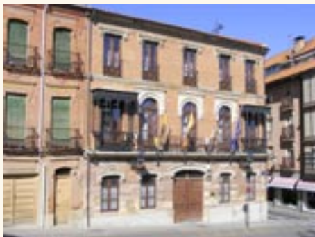
Casa del Cervato.

los arcos, cimbras y dinteles a modo de enmarque. En la planta principal un balcón corrido asoma a la fachada en los vanos centrales, siendo flanqueado por dos elegantes miradores de forja. Para ennoblecer el conjunto hacia el exterior se utiliza una rejería artesanal que combina sencillos elementos geométricos a base de discos, espirales, romboidales, etc. En la planta superior los balcones son de antepecho y