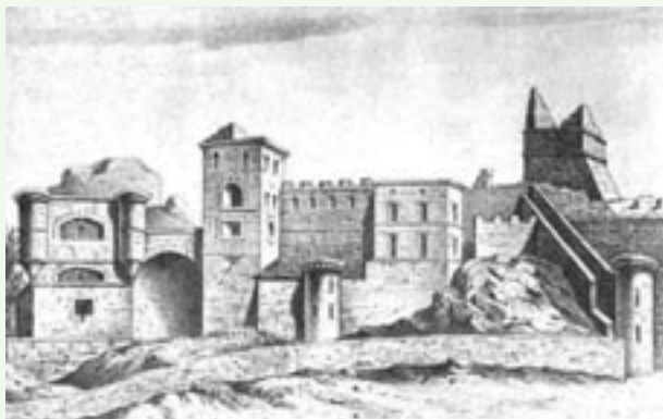
Castillo de Benavente. Recreación