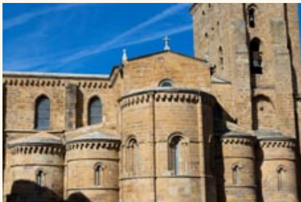
Los cinco ábsides.

nueva portada de líneas y aire clasicista.