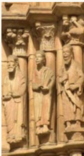
Profetas, portada sur.

amarillo, que se realizaron en el siglo XIII. Adornan los modillones una cabeza de toro (que simboliza a San Juan) y un sonriente ángel