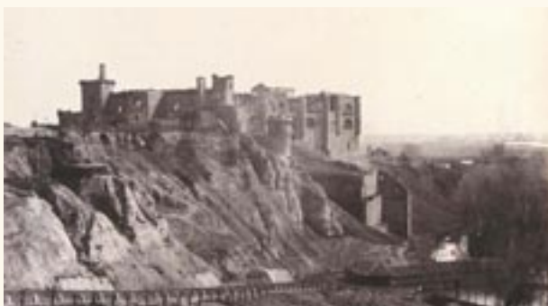
El Castillo en 1854 por Clifford.

tico es una mezcla de gótico y renacentista. Sus muros están contruidos de sillares de piedra. Aunque las ventanas conservan la traza de las cañoneras de un viejo castillo militar, por su decorativa balaustrada nos delata que este gran torreón corresponde a un momento constructivo en que la función militar se había cambiado por la de mansión palaciega. En su fachada sur se pueden ver algunos escudos de casa de los Pimentel.