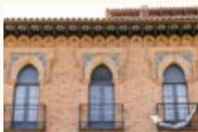
Casa de los Ramos. (Casa Donci).

Un remate cilíndrico corona la esquina del edificio, sobre él se alza una veleta con forma de media luna. Destacable es así mismo el gran alero volado de madera que remata las fachadas. Presenta éste, entre las vigas una decoración singular a base de estrellas de David pintadas de rojo, azul, amarillo y blanco que destacan vivamente