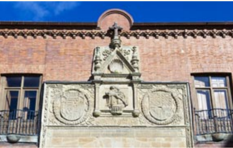
Fachada del Hospital de la Piedad. Detalle