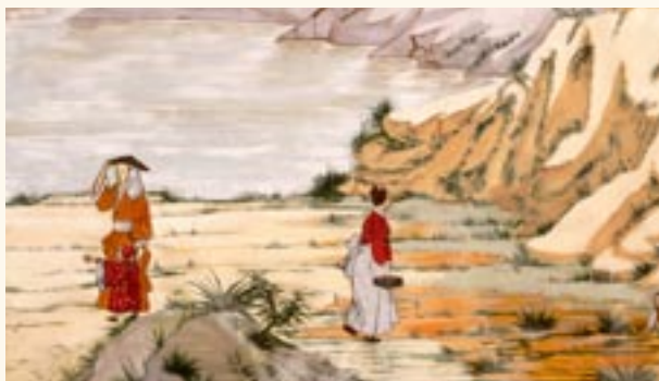
Pintura oriental sobre seda.