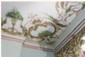
Sala de las palomas.

drada, se ordena en torno al núcleo que constituyen el patio central y la escalera principal de acceso. Posee además una bodega bajo rasante y una hermosa azotea con vistas a los jardines de la Mota.