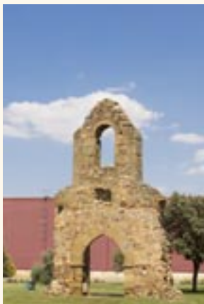
Espadaña de San Lázaro.

Esta edificación fue un antiguo sanatorio donde se proporcionaba albergue y asistencia a los enfermos que padecían determinadas enfermedades contagiosas. De ella existen datos ya en el siglo XV, realizándose en su entorno una romería conocida como “La Magdalena”.