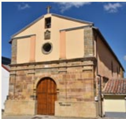
Ermita de la Soledad

vierte circunstancialmente en improvisado hospital para dar albergue a algunos de los afectados por las epidemias que asolan la comarca. Con posterioridad pasará a ser almacén del patrimonio imagi-