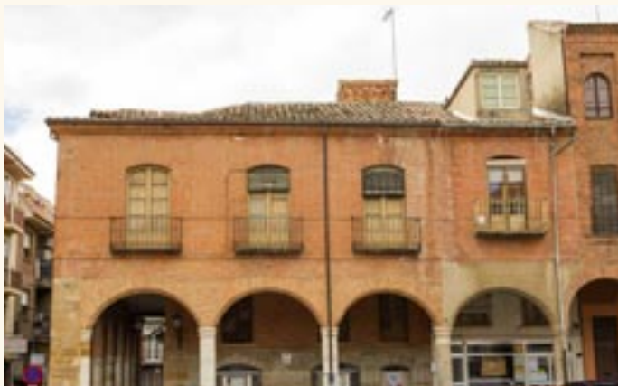
Casa de las Pescaderías.

conjunto son sin duda sus galerías porticadas, que se abren tanto a la Plaza Mayor como a la mencionada C/ de las Carnicerías.