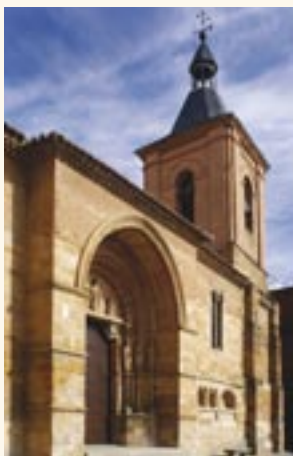
San Juan del Mercado

El documento del que estamos hablando fue firmado en septiembre de 1181 y entre los confirmantes figuran algunas de las personas que participaron en la repo-