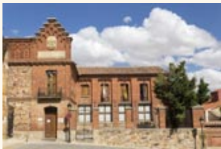
Edificio La Encomienda (Casa de Cultura)

Ubicada junto al templo de San Juan del Mercado. El proyecto original del edificio data de 1894, con posteriores modi-