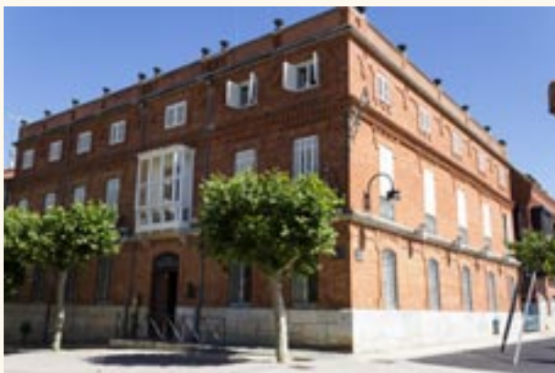
Casa de Solita.

Es un representativo palacete de la burguesía del novecientos. Emplazado en un lugar magnífico junto al mirador de la Mota, con hermosas vistas a la vega benaventana.