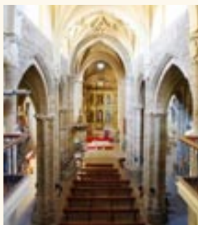
Interior Sta. María del Azogue.

En uno de los lados del Crucero sobre la puerta Norte del templo se localiza un gran escudo barroco de los condes de Benavente, benefactores del templo, sobre el mismo luce el lema de los Pimentel “Más vale volando”. En una de las capillas está la escultura del Cristo Marino.