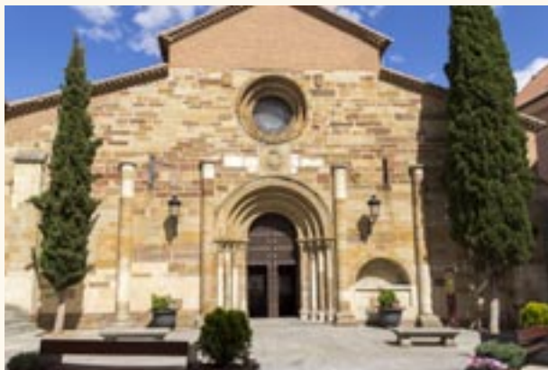
San Juan del Mercado. Puerta oeste.

en la actualidad existe un techo de madera con un tejado a dos aguas.