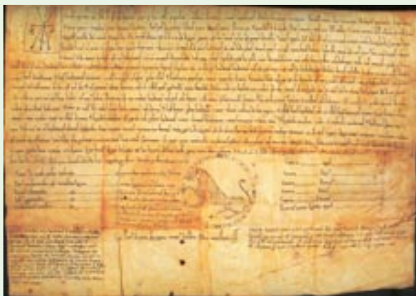
Fuero de Benavente. 1167

torga. Con posterioridad, en el siglo XII, la Villa aparece vinculada con el proceso de repoblación que llevaron a cabo los monarcas leoneses, denominándose por entonces Malgrat. Esta repoblación es impulsada por el rey Fernando II en el año 1164 mediante la concesión de un fuero o carta puebla, que sería renovado y ampliado en 1167. Este monarca inicia un periodo de expansión que