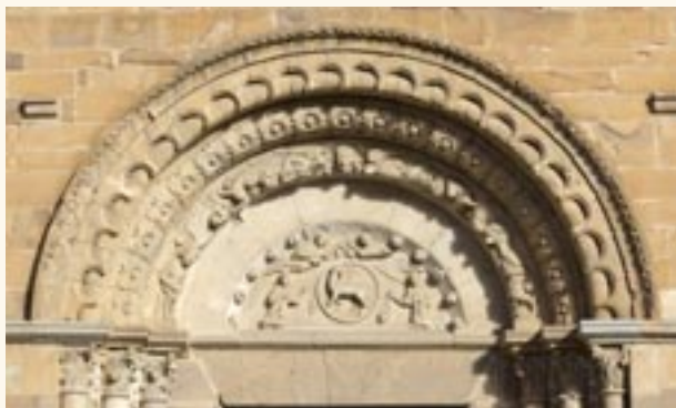
Portada meridional. "Agnus Dei"

de la ciencia del que pende el fruto prohibido, oculta con sus manos su desnudez porque ya ha pecado, mientras la serpiente se acerca al oído para tentarle; un león alado (símbolo del evangelista San Marcos); un ángel de pie sosteniendo en sus manos un libro abierto (símbolo del evangelista San Mateo). En el centro de la arquivolta la cabeza del Padre Eterno, la figura del Buen Dios rodeado por cuatro ángeles incensarios, dos en pie y dos en vuelo. A su lado un águila de alas abiertas (símbolo del evangelista San Juan); un toro alado (símbolo del evangelista San Lucas); y la Virgen María, de pie y en actitud orante, sobre un mascarón monstruoso que vomita tallos, representando una escena del Génesis. En el tímpano enmarcado en un clipeo o círculo, se