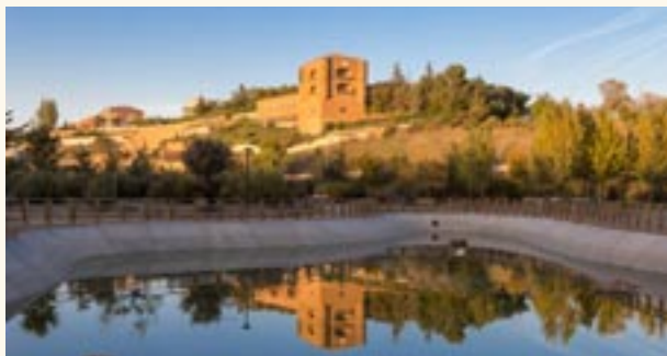
Panorámica de la Torre.