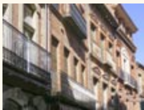
Fachadas de la Rúa.

Destaca la fachada del Hotel Mercantil, emblemático edificio del que se conserva la fachada de aire decimonónico integrada en una moderna construcción.