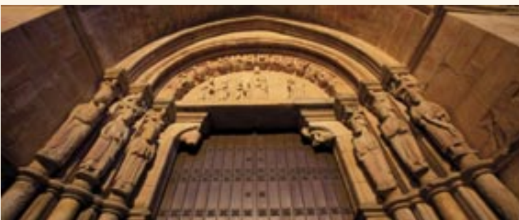
Puerta del Mediodía.

Magos dormidos, pues en sus sueños se les recomendó que no volviesen donde Herodes para notificarle donde se hallaba Jesús. En el centro se localizan cuatro ángeles músicos o alabando y entre ellos la estrella guía o de Belén.