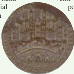
Sello del Concejo de Benavente, siglo XIII (anverso)

Un floreciente comercio se desarrolla en torno a sus ferias y mercados tradicionales y en 1929 es concedido a Benavente el título de ciudad por el rey Alfonso XIII.