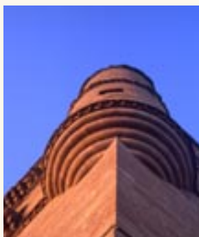
Torre del Caracol.

El conjunto se encuentra en la actualidad cubierto por un magnífico artesanado morisco. Es una obra del siglo XV y procede del que fuera Convento de San Román del Valle, donde estuvo localizado uno de los panteones de una rama de la dinastía de los Pimentel.