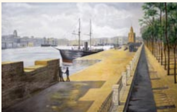
Pintura mural del puerto fluvial de Sevilla.

recogen principalmente a paisajes del Sur de España. Entre ellas se distingue el antiguo puerto fluvial de Sevilla junto al río Guadalquivir. También se encuentran algunas pinturas de gusto romántico con escenas idílicas y una máquina de ferrocarril, ya que el dueño de la Casa fue el principal promotor de la instalación ferroviaria en Benavente en 1896.