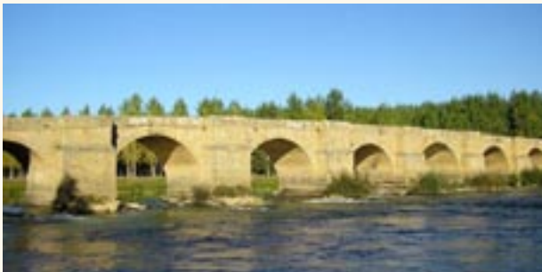
Puente medieval sobre el Esla.

Restaurado en numerosas ocasiones conserva la traza medieval y parte de sus ojos. A decir de algunos ingenieros de los siglos XVII y XVIII este puente era el más preciso del reino de León y uno de los pasos más necesarios de toda España, sobre todo para unir Galicia y Asturias con la meseta castellana. En realidad, se trataba de cuatro puentes con tres prados intermedios que se sucedían de una forma encadenada para salvar el cauce del Esla. Las frecuentes avenidas del río que inundaban la vega obligaban a su continua reparación, así ya en la Edad Media se levantaba el conocido Puente de Santa Marina. Posteriormente en el siglo XVI y XVII se construye el llamado puente Mayor o Puente Grande que contaba de 21 bóvedas. En el siglo XVIII y XIX algunos de sus tramos serán objeto de diversas ampliaciones y reparaciones.