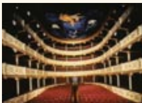
Interior del Teatro.

cando la calidad espacial de las distintas dependencias. En torno al patio de butacas se disponen tres plantas de palcos además de la platea. Los frentes de los palcos se hallan decorados con listones dorados y reproducciones en escayola de máscaras griegas. Los lienzos pintados de los techos de la antesala central y de la sala del teatro fueron realizados según bocetos de Jacobo Pérez-Enciso.