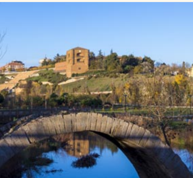
Arco del Puente del Jardín.

Desde sus proximidades puede obtenerse una de las más bellas perspectivas del Castillo y de los jardines de la Mota.