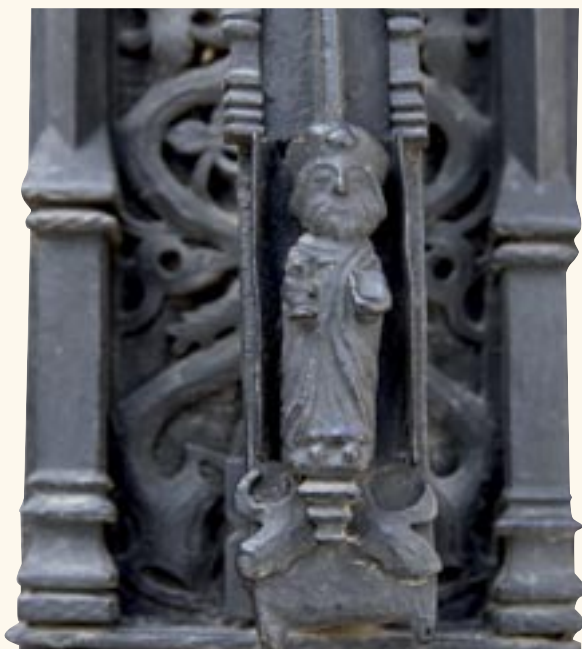
Llamador de hierro forjado con la figura de Santiago peregrino.

realizada en minúsculas francesas o góticas, encima de él aparece un alto relieve que representa la escena de la Piedad. Remata el conjunto un frontispicio con una concha en el centro y candeleros. A ambos lados del al-torre relieve de la Piedad se