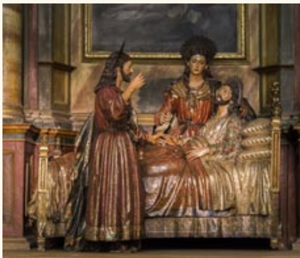
La Muerte de San José. Comienzos del s. XVIII.