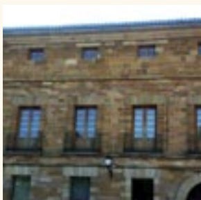
Palacio de los Condes de Patilla

Construido a mediados del siglo XIX sobre una de las grandes casas que los Pimentel, con-