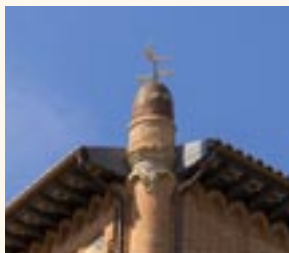
Remate cilíndrico que corona el edificio.