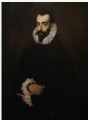
Juan Alfonso Pimentel. El Greco.

se desarrollará durante los siglos XII y XIII. Benefactor de la villa cambia su nombre por el de Benavente, donde reúne la Curia regia en 1176 y muere en 1188. Posteriormente Alfonso IX reúne Cortes en ella en 1202 y Sancho IV fomenta su engrandecimiento mediante la concesión de nuevos privilegios, atrayendo con franquicias a nuevos pobladores.