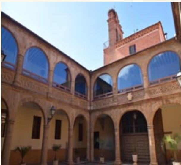
Patio interior del Hospital de la Piedad.

XVIII), un tema difícil de encontrar y todo él decorado con bella policromía.