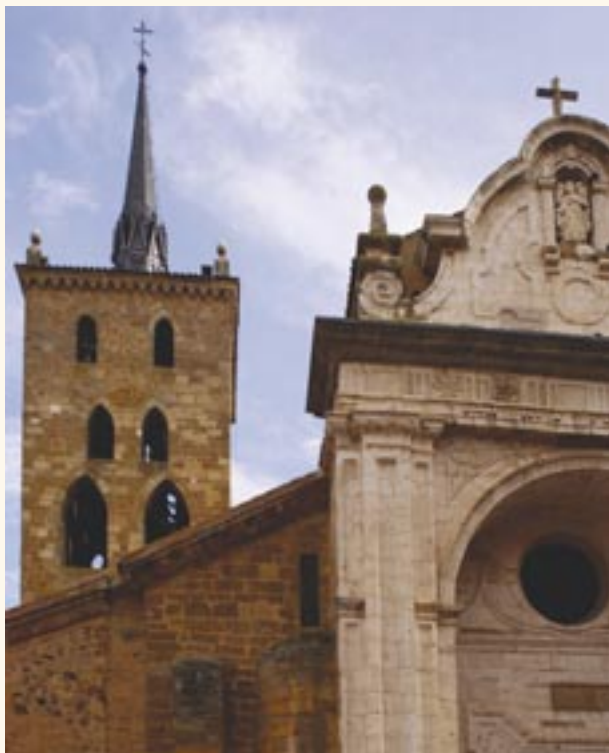
Torre y fachada clasicista.

templo y se concluye el actual espacio de la sacristía en estilo tardogótico - renacentista, la cual en principio debió ser un panteón nobiliario.