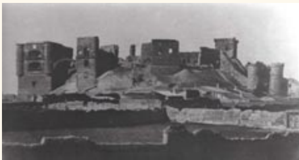
Vista Sur del Castillo. Finales del S.XIX.

parte de todo el conjunto fortificado, compuesto por tres recintos amurallados que en sus épocas de esplendor se podía admirar.